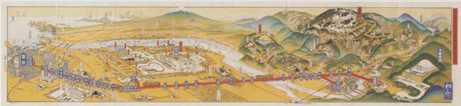
京王電車沿線名所図説