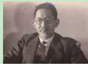
建築家・蔵田周忠

明治天皇の行幸を記念して昭和 5 年（1930）に開館した多摩聖蹟記念館（現・旧多摩聖蹟記念館）。当館は、昭和 61 年（1986）に多摩市の指定有形文化財に指定され、平成 14 年（2002）に東京都の「特に景観上重要な歴史的建造物等」、令和 4 年（2022）には DOCOMOMO Japan による 2021 年度「日本におけるモダン・ムーブメントの建築」に選定されるなど、建築の観点からも高く評価されています。当館を設計したのは、関根要太郎（1889～1959）と関根の建築事務所に所属していた蔵田周忠（くらたちかただ 1895～1966）です。近代日本における最初の建築運動をおこした分離派建築会に参加していた蔵田は、大正 11 年（1922）に技師として関根要太郎建築事務所に入所し、多摩聖蹟記念館や京王閣の設計を担当しました。本展は、蔵田周忠にスポットを当て、その生涯を振り返るとともに、建築という視点から旧多摩聖蹟記念館の魅力をつえ直す企画展です。