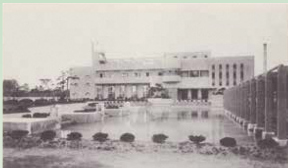
京王閣 1927 年

明治天皇の行幸を記念して昭和 5 年（1930）に開館した多摩聖蹟記念館（現・旧多摩聖蹟記念館）。当館は、昭和 61 年（1986）に多摩市の指定有形文化財に指定され、平成 14 年（2002）に東京都の「特に景観上重要な歴史的建造物等」、令和 4 年（2022）には DOCOMOMO Japan による 2021 年度「日本におけるモダン・ムーブメントの建築」に選定されるなど、建築の観点からも高く評価されています。当館を設計したのは、関根要太郎（1889～1959）と関根の建築事務所に所属していた蔵田周忠（くらたちかただ 1895～1966）です。近代日本における最初の建築運動をおこした分離派建築会に参加していた蔵田は、大正 11 年（1922）に技師として関根要太郎建築事務所に入所し、多摩聖蹟記念館や京王閣の設計を担当しました。本展は、蔵田周忠にスポットを当て、その生涯を振り返るとともに、建築という視点から旧多摩聖蹟記念館の魅力をつえ直す企画展です。