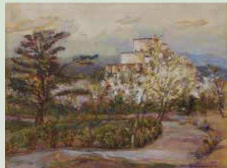
中林僊「多摩聖蹟記念館」1934-37 年