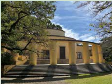
旧多摩聖蹟記念館 1930 年