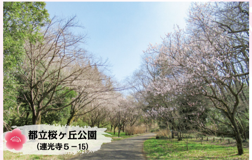
都立桜ヶ丘公園 (連光寺5-15)