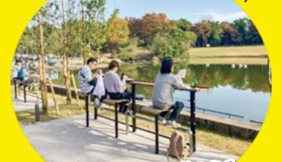
多摩中央公園大池前テラス