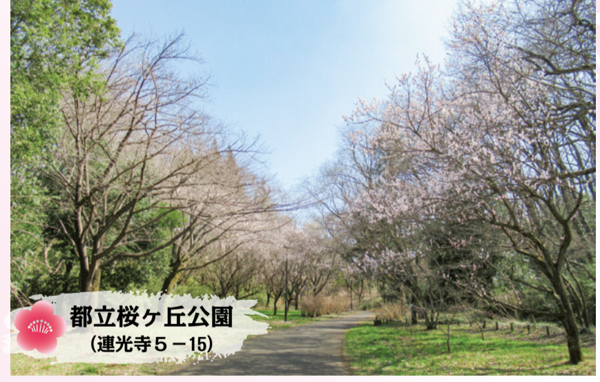
都立桜ヶ丘公園 (連光寺5-15)