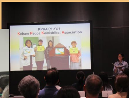
恵泉女学園大学紙芝居研究会クプカ▲

恵泉女学園大学紙芝居研究会クプカと歴代派遣員でもあり、クプカリトルシスターズのメンバーの3名による紙芝居『二度と』の実演を行い、来場者の皆さんに平和へのメッセージを届けました。