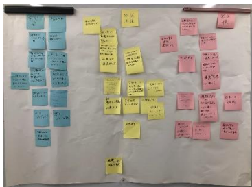
<グループ意見まとめ>