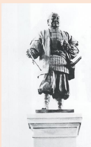
4「徳川家康像」「太田道灌像」東京・府庁舎内