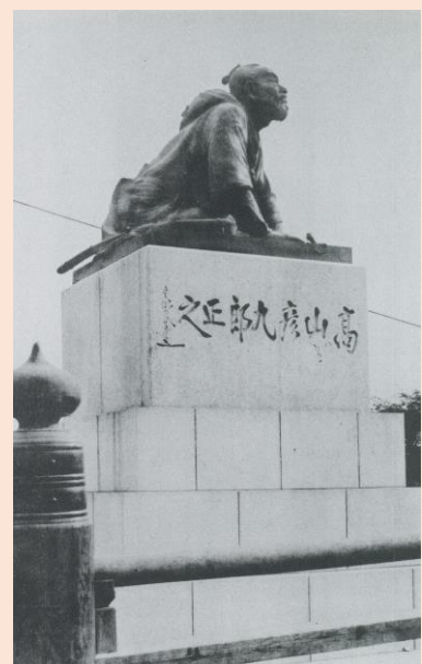
3「高山彦九郎像」京都・三条大橋