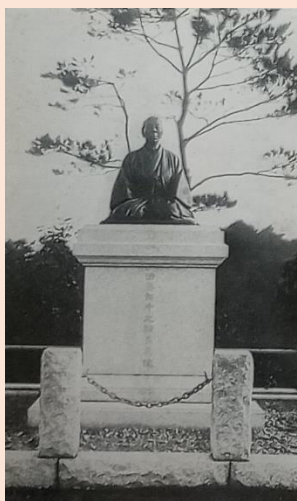
5「田中光頭座像」多摩聖蹟記念館参道