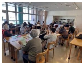
↑スマホサロン(関戸)

ているが、居住地に近く、高齢者が気軽に参加できる事業として引き続き実施していきたい。