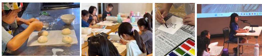
← ↑ 夏休み小学校体験講座

パパ子クッキングは父親応援として企画し、実際に妻に背中を押されて参加した方が多数であった。料理経験も未経験の方が揃う中、他の参加者と役割分担するなど、親子の繋がりだけでなく親同士・子同士のコミュニケーションの場としても機能した。子どものうち7組は低学年であり、「子に料理体験をさせたい」というニーズも伺えた。