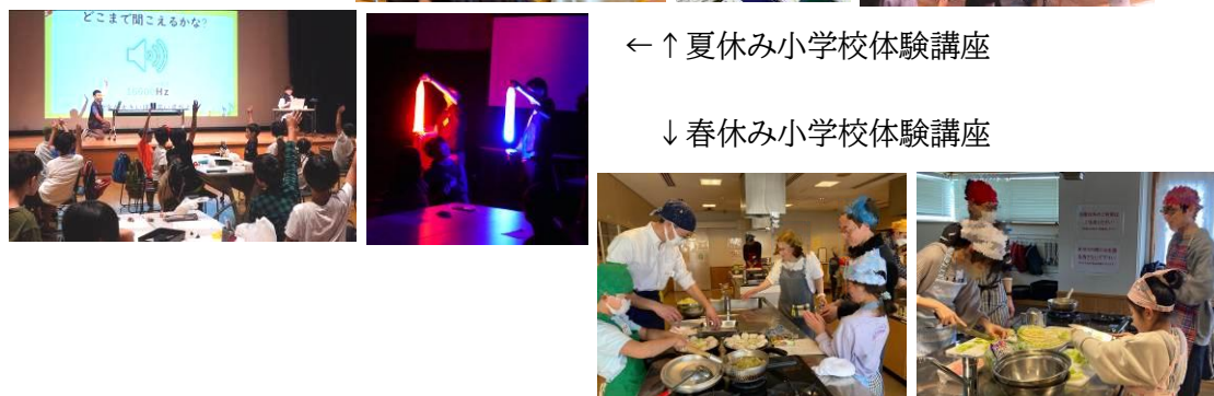
↓ 春休み小学校体験講座