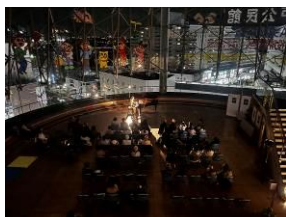
←市主催事業(星宇宙ミーティング[スターライトコンサート])

■ まとめ 令和7年度は、市民団体等との協働事業ならびに市主催事業の計15事業を実施した。協働事業実施では、市民団体等と積極的にコミュニケーションをとり、可能な限り実施につなげていくことで、多くの団体と共に市民ロビー活用の機会を創出し、公民館の賑わいづくりや周知につなげていった。