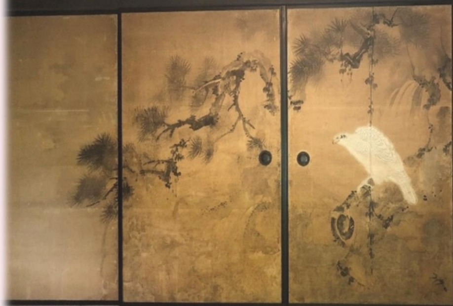
旧富澤家襖絵「深山白鷹」／多摩市教育委員会保管・富澤家資料