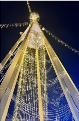
▲ センターランドツリー