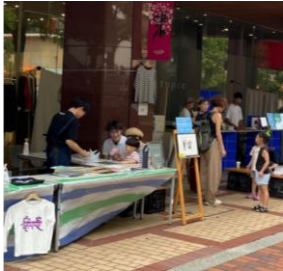
▲ 前回9月のワークショップの様子