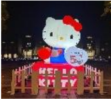
▲ バルーンイルミ ※画像はイメージです ▲ 光の水族館 © 2025 SANRIO CO., LTD. APPROVAL NO. P171018-1