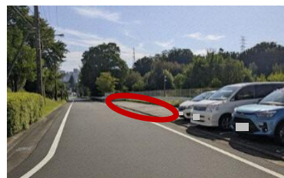
図 住宅地内における タクシー待機場所整備の例

<取組例> 住宅地内におけるタクシー待機場所の整備 / タクシーチケット配布の検討