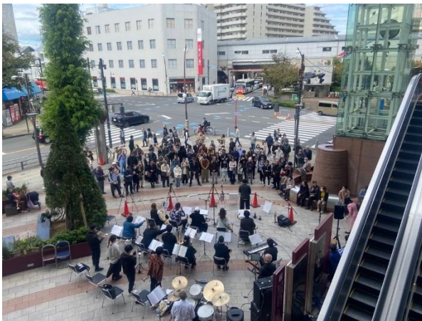
せいせき音フェス