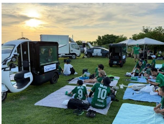
東京ヴェルディみんなでパブリックビューイング in せいせきカワマチ

こうした取り組みが、昼夜を問わず多摩市の魅力を満喫できる機会を提供し、来訪者の満足度を向上させています。