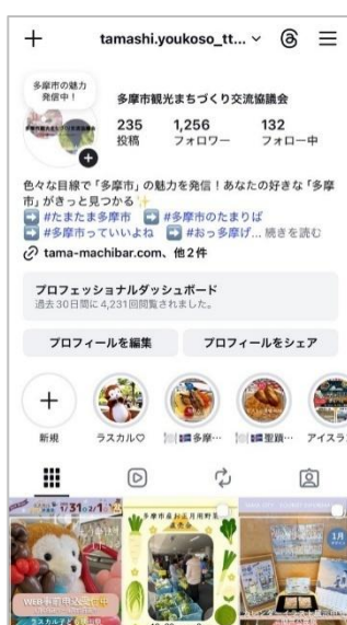
観光まちづくり交流協議会 公式インスタグラム