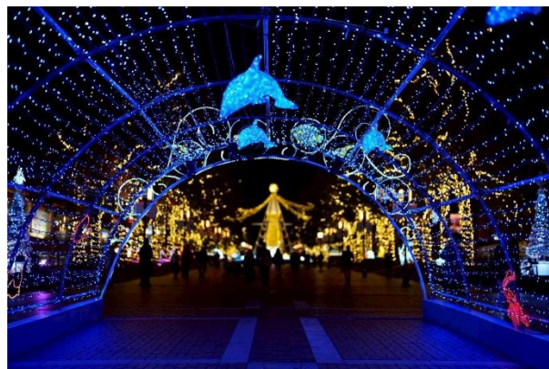
多摩センターイルミネーション