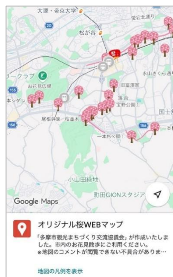
オリジナル桜マップ