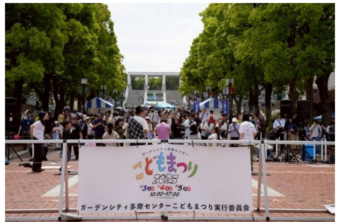
多摩センターこどもまつり