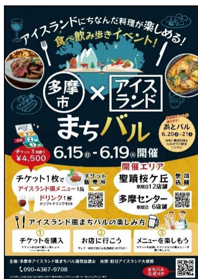
令和7年6月に開催された 多摩市アイスランド風まちバル

その後、新型コロナウイルス感染症拡大の影響により、実際の活動が制限される中でも、多摩市の魅力発信の活動として、「多摩市食プロジェクト」の実施、インスタグラムの開設、グーグルマイマップを利用したオリジナル桜マップの作成を行うなど、各協議会会員の視点からの多摩市の新たな魅力を発信等に取り組んでいます。