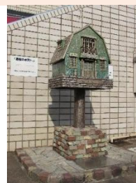
せいせき観光まちづくり会議が設置した「青春のポスト」

(注)「耳をすませば」公開10周年にあたり、市内の大学生が聖蹟桜ヶ丘の商店会と連携して上映会を開催したことを契機に設立された市民団体。散策マップや看板の設置、青春のポストの作製やガイドツアーなど、聖蹟桜ヶ丘の豊かな自然と長い歴史、そして多くの映画やドラマ、アニメーション作品の舞台や参考となった街の魅力を守り、未来へと受け継ぐことを目的に活動している。