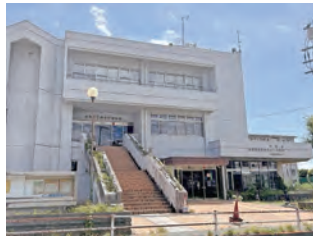
▲現在の東寺方複合施設

答 子どもと信頼関係を築いて、職員が子どもの見守りをしていくのが基本である。どのような職員がどのように関わっていきけるか、しっかり検証していきたい。