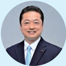
多摩市議会議長 三階 道雄