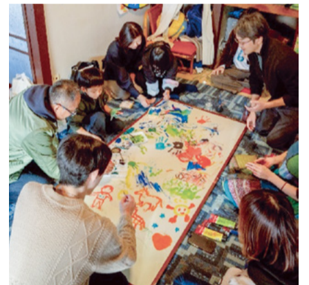
昨年度の採択事業の様子▲