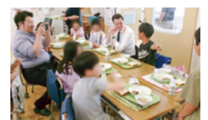
▲駐日アイスランド大使館職員による小学校訪問(令和7年)

日 6月15日(月)~19日(金)(期間中1日のみ提供。提供日は学校により異なる)