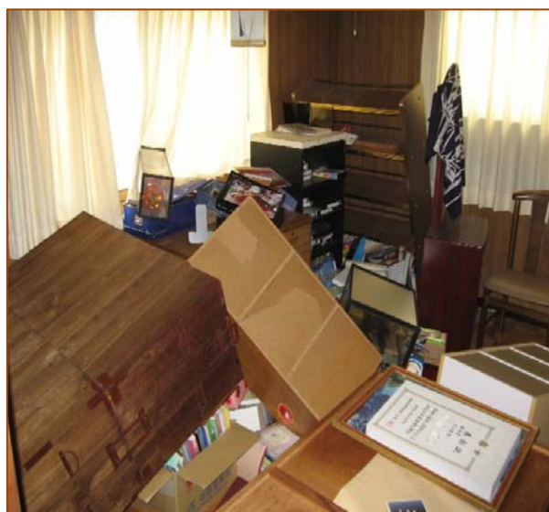
家具類の転倒防止対策を取っていないかった部屋の様子。これでは、逃げるのもひと苦労。（新潟県中越沖地震）