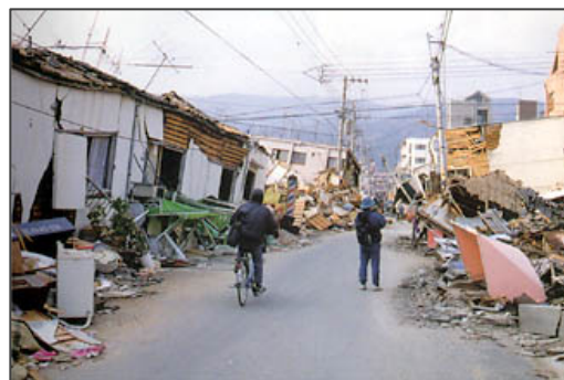
神戸市役所提供「兵庫県南部地震データ集」