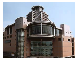
聖蹟桜ヶ丘駅前にあります。