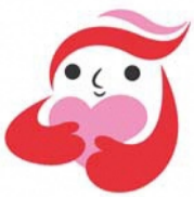
犯罪被害者等支援シンボルマーク「ギュっとちゃん」

「あたたかさ 伝わる言葉 あなたから」 (平成29年度犯罪被害者等に関する標語 最優秀作品)