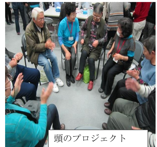
頭のプロジェクト