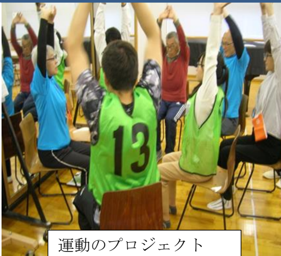
運動のプロジェクト