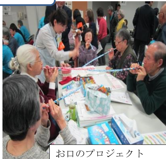
お口のプロジェクト